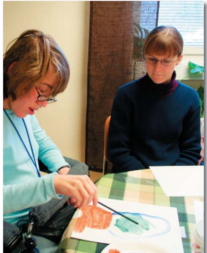
Yrket "Personlig Assistent" är precis vad titeln innebär – att assistera och hjälpa – vara nära men aldrig ta över.

NÄRA har en beredskap för akuta situationer som kan uppstå inom uppdraget. Denna finns att nå dygnet runt.