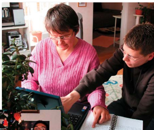
I NÄRA anställer vi kvinnor och män med olika bakgrund, intressen och ålder.

Självklart har servicekunder kollektivavtal och avtalsförsäkringar.